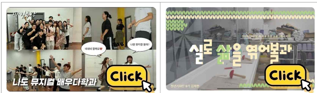
2025 개설학과 운영사례 - 유튜브(보라그래TV) 연결